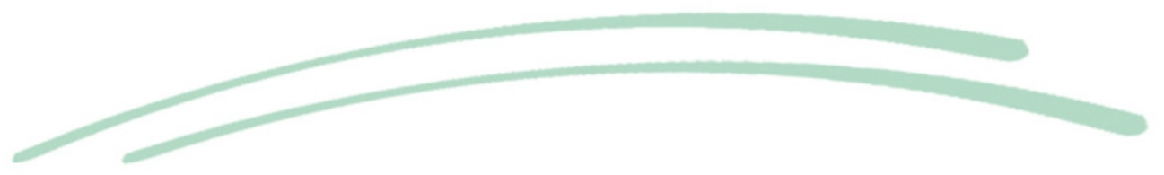
เด็กทิวไผ่งาม > M.2-M.6